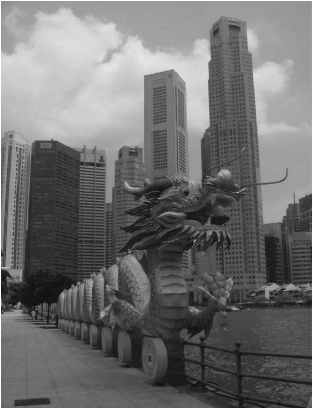
ფოტო 1.1 გლობალიზაცია და აღმოსავლეთ აზიის აყვავება: სინგაპურის პორტის ხედი